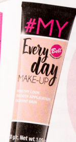
Maquillaje My Every Day de Bell Cosmetics. Tono aterciopelado. 5,99€