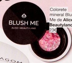
Colorete mineral Blush Me de Alice in Beautyland. 23€