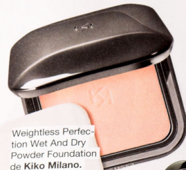
Weightless Perfection Wet And Dry Powder Foundation de Kiko Milano. Base compacta en polvo, acabado mate. 13,99€