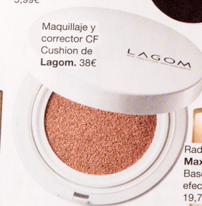
Maquillaje y corrector CF Cushion de Lagom. 38€