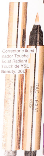
Corrector e iluminador Touché Éclat Radiant Touch de YSL Beauty. 36€