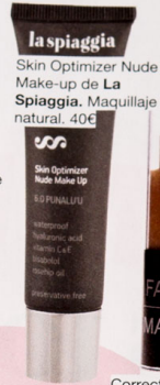
la spiaggia Skin Optimizer Nude Make-up de La Spiaggia. Maquillaje natural. 40€