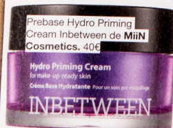
Prebase Hydro Priming Cream Inbetween de Miin Cosmetics. 40€