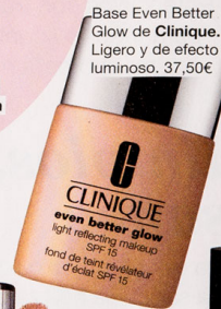
Base Even Better Glow de Clinique. Ligero y de efecto luminoso. 37,50€