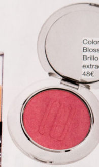
Colorete The Blush Blossom de Zelens. Brillo natural y con extracto de baobab. 48€