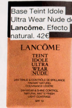
Base Teint Idole Ultra Wear Nude de Lancôme. Efecto natural. 42€